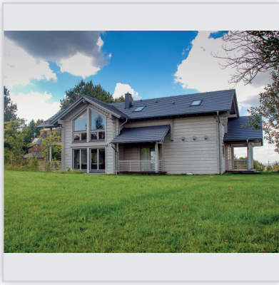
Findrewno, Dom całoroczny. Powierzchnia: ok. 200 m 2 . Ściany wykonane z bali laminowanych o grubości 182 mm.