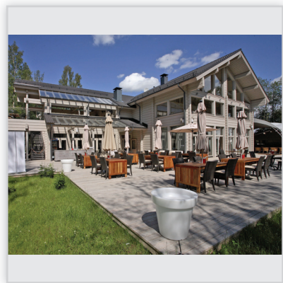
Findrewno, Budynek restauracyjny wraz z zapleczem kuchennym. Powierzchnia: 350 m 2 . Ściany wykonane z bali klejonych grubości 204 mm.