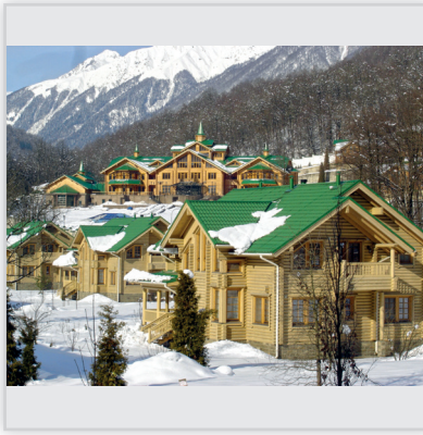
Findrewno, Krasnaja Polana k. Soczi w Rosji – największe na świecie skupisko domów z bali. Powierzchnia: 64 domy o powierzchni 250, 300 i 350 m 2 oraz budynek główny o powierzchni ok. 2000 m 2 . Domy wykonane z bali okrągłych o grubości 230 mm. Gdyby ułożyć wszystkie bale użyte do budowy tego kompleksu jeden za drugim zajęłyby ponad 250 km.