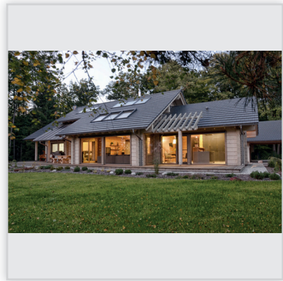
Findrewno, Dom referencyjny firmy Findrewno. Powierzchnia: 225 m 2 . Ściany wykonane z bali klejonych grubości 204 mm.