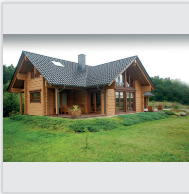
Findrewno, Dom całoroczny. Powierzchnia: 220 m 2 (180 m 2 dom + 40 m 2 garaż). Ściany wykonane z bali klejonych z 6 elementów grubości 182 mm.