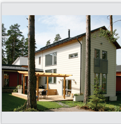
Findrewno, Dom całoroczny zaprojektowany w modnym ostatnio stylu minimalistycznym. Powierzchnia: 180 m 2 . Ściany wykonane z bali klejonych z 6 elementów grubości 204 mm.