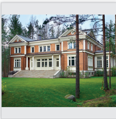
Findrewno, Rezydencja. Powierzchnia: 700 m 2 . Ściany wykonane z bali klejonych z 6 elementów grubości 204 mm.