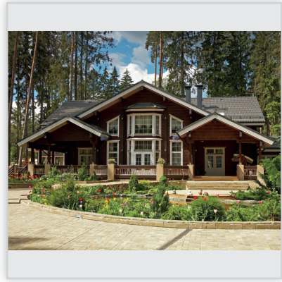
Findrewno, Dom całoroczny. Powierzchnia: ok. 260 m 2 . Ściany wykonane z bali klejonych grubości 182 mm.